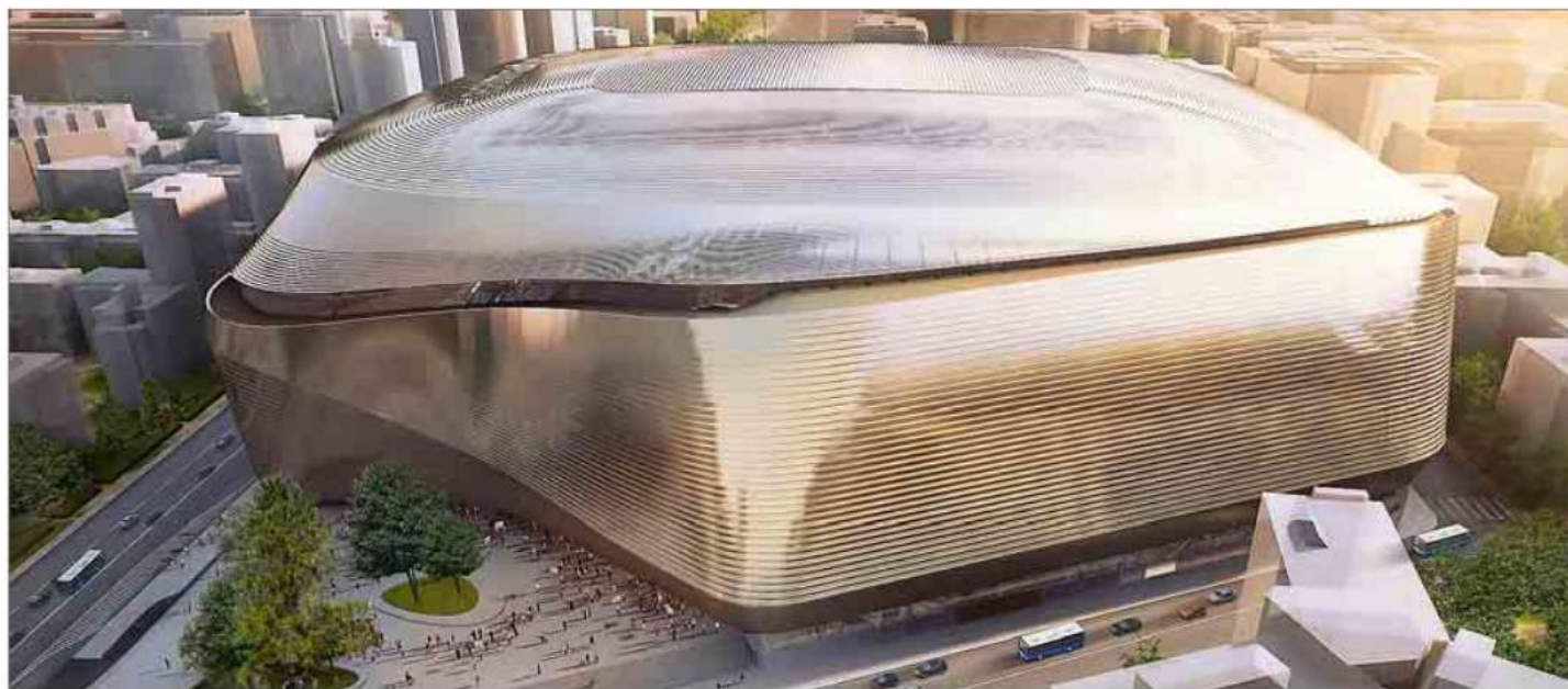
Recreación del nuevo Santiago Bernabéu con la esquina ajardinada entre Concha Espina y Padre Damián en primer término.