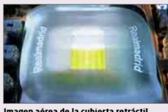
Imagen aérea de la cubierta retráctil.