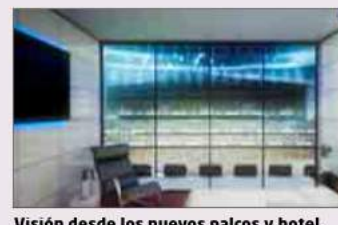
Visión desde los nuevos palcos y hotel.