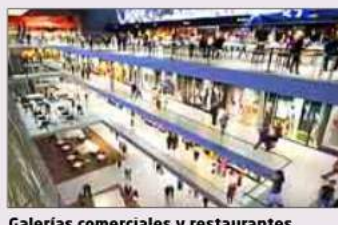
Galerías comerciales y restaurantes.