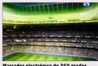
Marcador electrónico de 360 grados.