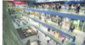
Videomarcador de 360°