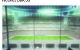
Desde el año 2000, cuando Florentino llegó a la presidencia, hasta hoy se han invertido 208 millones de euros en remodelar el Bernabéu. Mas 200 millones en la construcción de Váldebas.