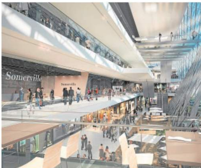
Recreación de cómo será el centro comercial