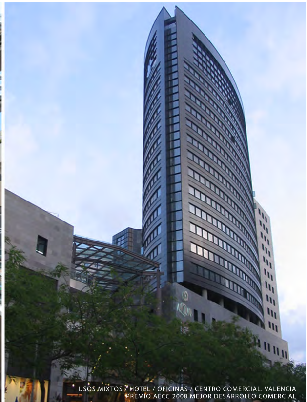
USOS MIXTOS / HOTEL / OFICINAS / CENTRO COMERCIAL. VALENCIA PREMIO AECC 2008 MEJOR DESARROLLO COMERCIAL