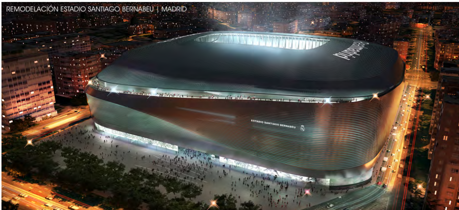
REMEDIACIÓN ESTADIO SANTIAGO BERNABEU | MADRID