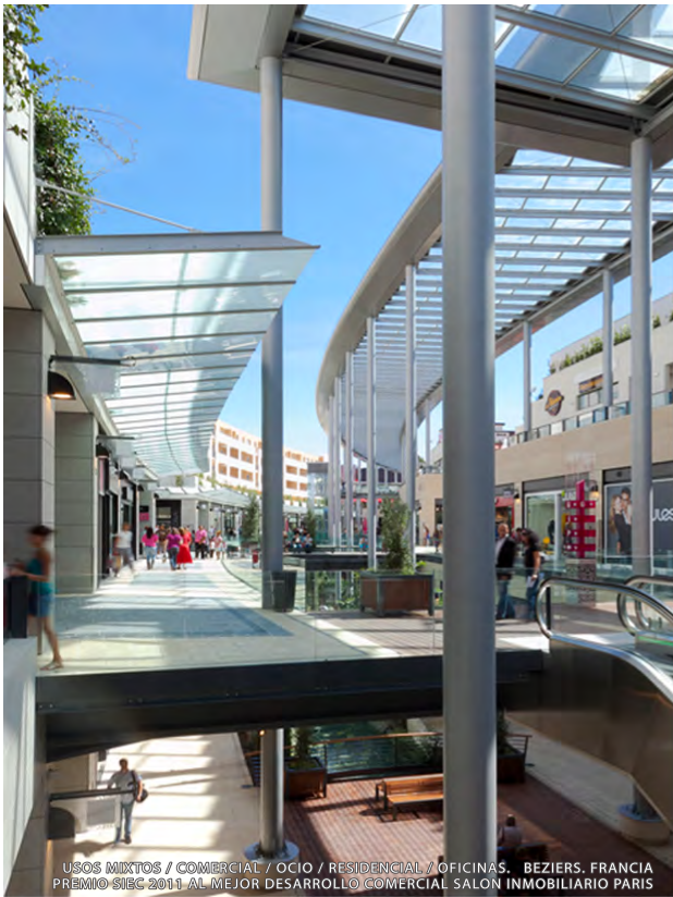
USOS MIXTOS / COMERCIAL / OCIO / RESIDENCIAL / OFICINAS. BEZIERS. FRANCIA PREMIO SIEG 2011 AL MEJOR DESARROLLO COMERCIAL SALON INMOBILIARIO PARIS