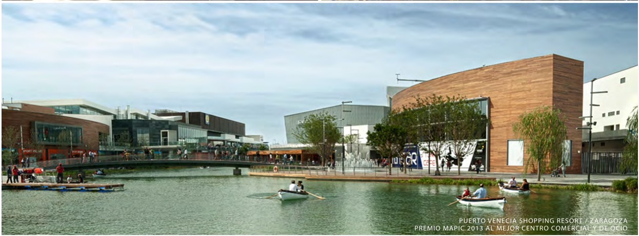
PUERTO VENECIA SHOPPING RESORT / ZARAGOZA PREMIO MAPIC 2013 AL MEJOR CENTRO COMERCIAL Y DE OCIO