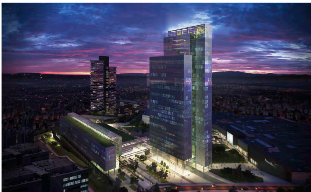
Edificio usos mixtos, oficinas residencial, comercial .Estambul . TURQUIA

La gestión, operativa y mantenimiento de los edificios en un contexto de crisis económica hace ver que la sostenibilidad es una inversión en el largo plazo. Muchas de las cuestiones que tienen que ver con la sostenibilidad a su vez tienen que ver con nuestras propias expectativas de confort y ambas deben acomodarse a esta situación.