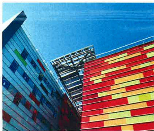
Avec son architecture marquante, El Centre del Món devient une des constructions emblématiques qui donnent à Perpignan son identité.

Le projet urbain poursuit son développement autour de cette réalisation phare. Il prévoit la construction de près de 1 700 logements neufs, la création d'un parc urbain situé de part et d'autre de La Basse, la création d'un réseau