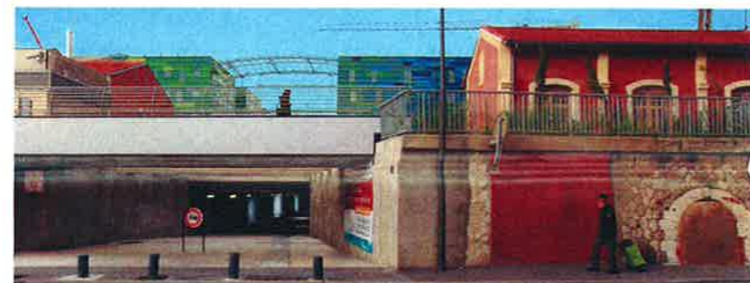
Quel contraste entre les 8 mètres de large du passage Dali et les 1,20 de l'ancien tunnel dont l'entrée (à droite) est à présent murée !

La Ville a, par exemple, négocié avec la SNCF afin de pouvoir faire des puits de lu-