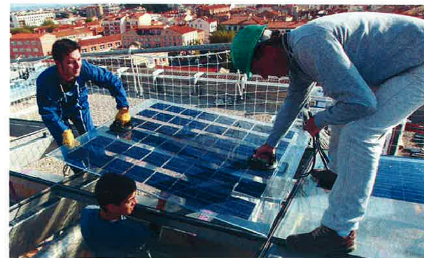
Perchés sur une plate-forme suspendue à la vague, les techniciens de l'entreprise perpignanaise Cansol posent les modules photovoltaïques.

acité de 20%, 50% et 90%. Leur agencement donne une vision qui, dans l'esprit des concepteurs, rappelle le clavier d'un piano ou un damier. ■