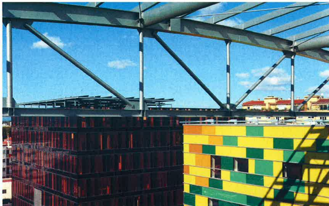
El Centre del Món de Jos Galán et l'Hôtel d'Agglomération réalisés par Dominique Perrault, l'architecte de la Bibliothèque Nationale de France.

« Nous avons privilégié la proposition architecturale. Le jury a fait un choix audacieux en choisissant notre projet. »