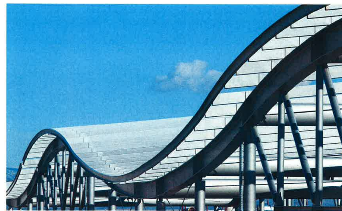
Au-dessus des bâtiments, la vague avant la pose des modules photovoltaïques.

« Bulle » ou « galet » ? La structure la plus spectaculaire d'El Centre del Món sera construite en 2011. Elle accueillera une salle de sport et une crèche exploitées par des entreprises privées.