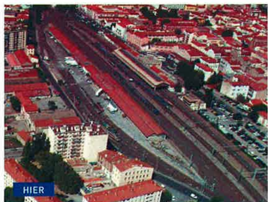
D'une longueur de 350 mètres et d'une largeur de 45 mètres, El Centre del Món a été construit sur l'emplacement qu'occupaient les entrepôts de la STEF.

Note : Metrovacesa est la plus importante société immobilière d'Espagne. El Centre del Món est son premier grand projet sur le marché français.